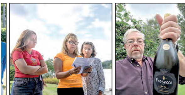
allmän munterhet. Fotografen överlevde och knep till slut förstaplatsen i den hårda kampen.