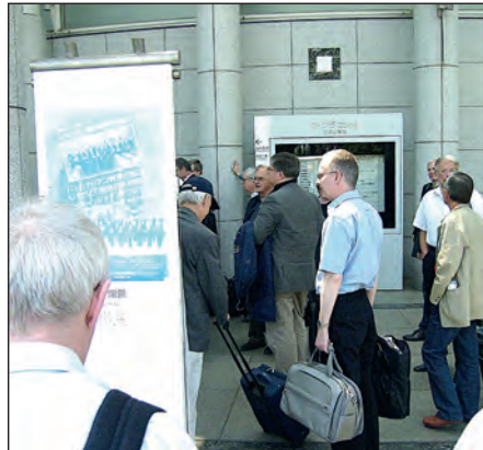
DBK anländer till Konserthuset i Tokyo.

Text Jan Hinds O DBK Fotograf anges vid resp bild