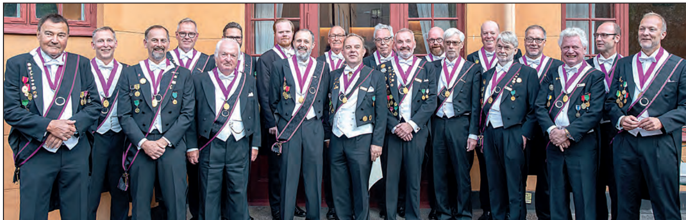
De nyrecipierade Bröderna.