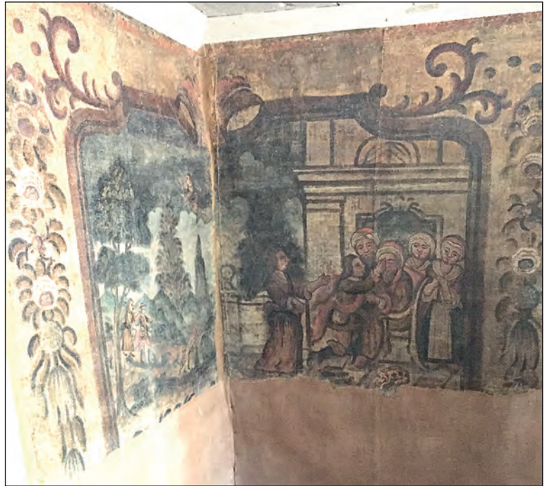
Oljemålade vävtapeter med motiv ur Tobits bok hör till fynden på Bellmanshusets andra våning.