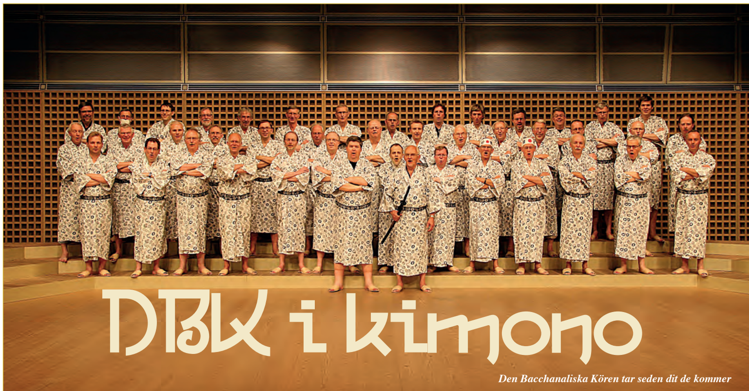
Den Bacchanaliska Kören tar seden dit de kommer

Efter DBK:s stora Amerikaresa 1988 genomförde kören ett antal konsertresor inom Europa, men den 20 april 2007 stod Den Bacchanaliska Kören återigen redo för en långresa, denna gång till Japan.