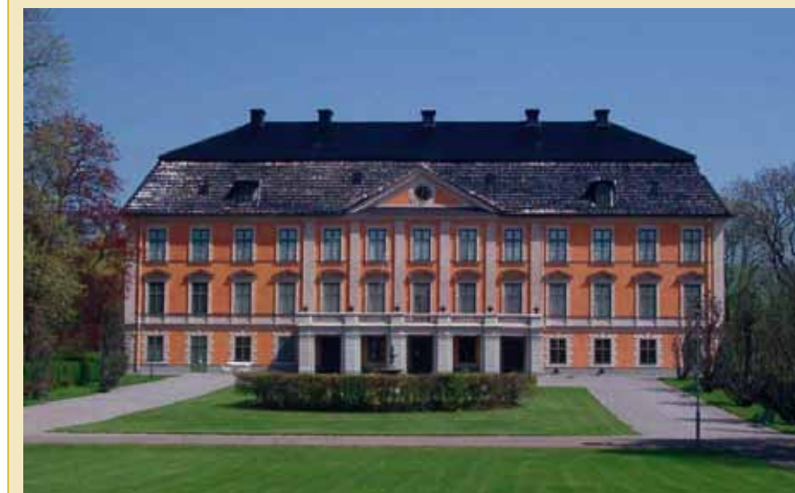
Nynäs slott, bild lånad av Bålinge Hembyggsförening.

Tips mottas med tacksamhet till Claes Tottie, claes.tottie@tele2.se eller 08-87 62 93. Ett förslag är Sigtuna Stadshotell.