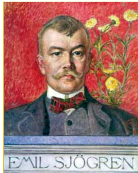
Emil Sjögren såsom vännen Carl Larsson såg honom.